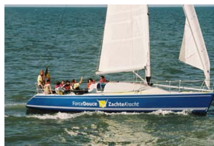
Première sortie en mer

Ces stages sont organisés conjointement par les asbl