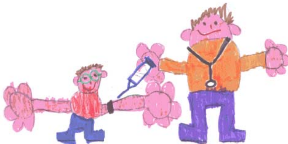
Dessin reproduit avec l'aimable autorisation de l'artiste.

Ensemble, pas à pas est une asbl active au sein de l'Unité d'Onco-Hématologie de l'Hôpital Universitaire des Enfants Reine Fabiola à Bruxelles.