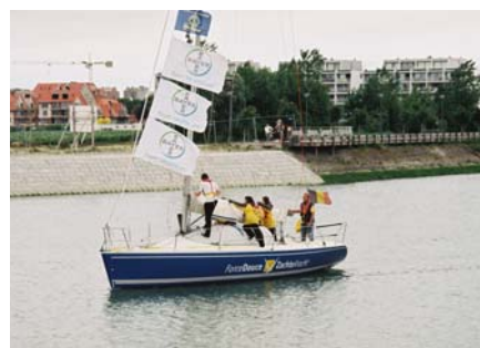
Retour au port : dernières manoeuvres

Pour tout renseignement : M.Ch. Schoevaerts : 02.425.60.54 ou mc.schoevaerts@ensemble-pasapas.be .