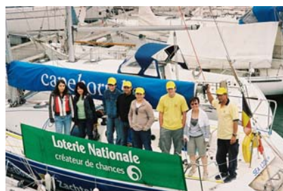
Accueil à Nieuport et premières instructions du skipper